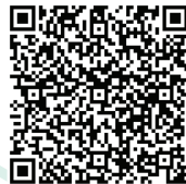
教務處 選課Q & A