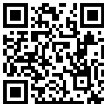
應用外國語文學系FB 社團: 中原應外