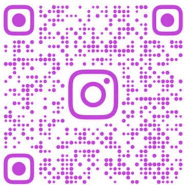
應用外國語言學系學會 IG粉專: cycu_all